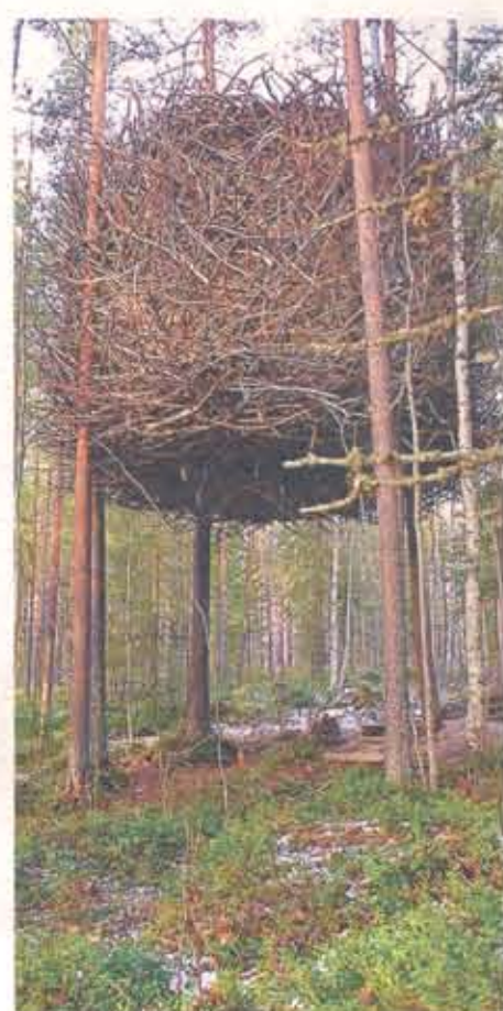
Kabinen är placerad högt uppe i träden och nås via en horisontell brygga som löper mellan stammarna. The Blue Cone är en illröd skapelse inredd i furu. The Birdnest liknar mest ett fågelbo, men innanför nätverket av grenar ryms all tänkbar bekvämlighet i form av sovrum, toalett och sällskapsrum.