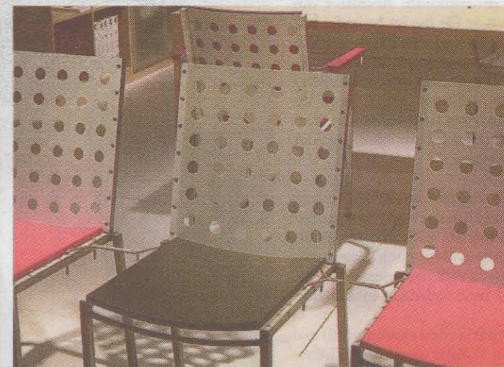
Aluminiumstolen i Åke Axelssons Balticmöblering kan göras bekvämare med mjukare polyuretan eller karmar. Tillverkare Galleri Stolen.