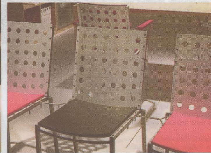
Aluminiumstolen i Åke Axelssons Balticmöblering kan göras bekvämare med mjukare polyuretan eller karmar. Tillverkare Galleri Stolen.