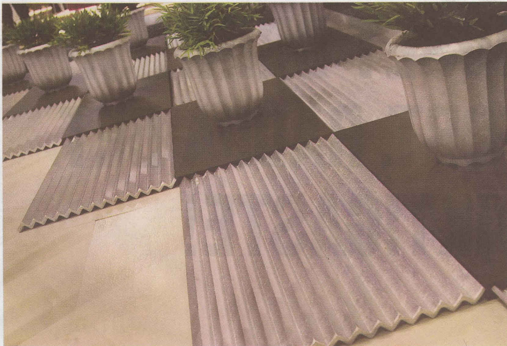
Mårten Cyrén har med sin fotskrapa i gjuten aluminium för Byarums bruk, lyckats förnya en praktisk trotjänare som väcker sparsmakade kollegers habegär.